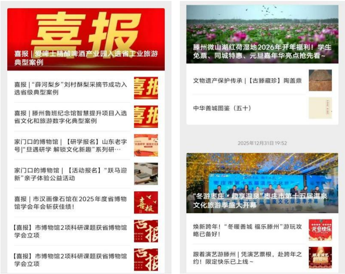
滕州市文化和旅游局“文旅滕州”公众号