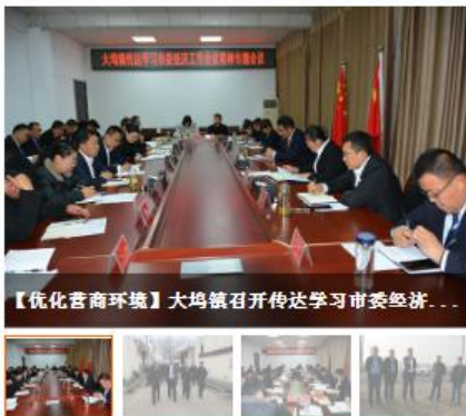
【优化营商环境】大坞镇召开传达学习市委经济...