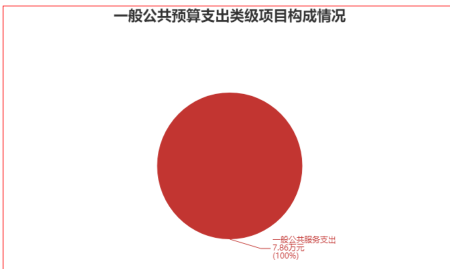
一般公共预算支出类级项目构成情况